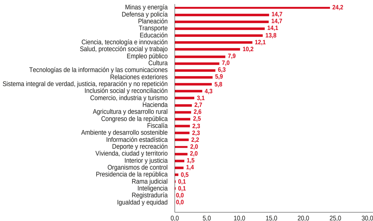
Gráfico 2. Ejecución Presupuestal por Sector con corte a marzo de 2024 (%)