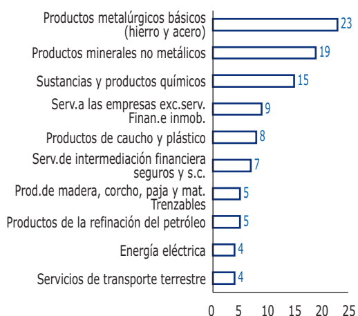
Gráfico 1. Efecto en consumo intermedio del sector cuando aumenta en $100 el valor bruto de la producción de construcción de edificaciones ($ pesos)